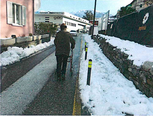
Via la Paré

Alcune foto significative scattate sulle nostre strade: